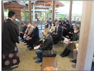
鎌倉宮ご祈祷後のお話