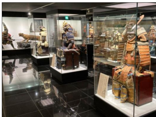
泰巖歴史美術館内

2日目の最初の見学場所は、宿舎と同じ町田市内にある泰巖歴史美術館です。こちらは、織田信長を中心として戦国時代の武將に由来した武器・文物のコレクションです。本来の開館時間は午前10時からなのですが、我々の都合で無理を言って30分早く入場させて貰いました。館内は1階から5階まで各階ごとにテーマ分けした展示をされており、当日は学芸員の方の説明を受けながら展示品について新しい美術館で展示方法