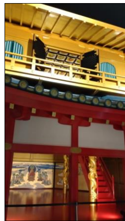
左：鎌倉宮境内散策の一場面、右：泰巖歴史美術館内に再現された安土城天守

す。前述の如く令和3、4年に前回の請求を行つたに続き、本年度は全般的に繰越金額が少なくなつております。従いまして、本年度は全般的に繰越金額が少なくなつております。本年度は全般的に繰越金額が少なくなつております。