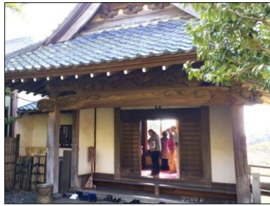
榎亭の玄関(鎌倉山中腹)