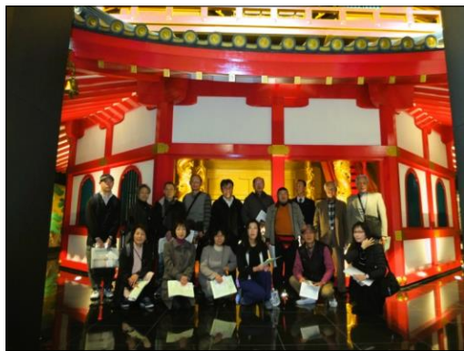
泰巖歴史美術館内

も斬新で見応えのある展示内容でした。また館内には安土城天守閣の一部や茶室が復元展示されていて目を引きました。