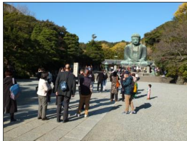
有名観光地は大変な賑わい