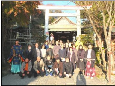
鎌倉宮の正面での一枚