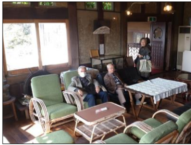
榎亭の広間でくつろぐ

合わずに孤立。その後、この地の土牢に幽閉され、戦乱の混に降、長い時代の死を遂げます。在が忘れられていたが、明治2年に明治天皇の命により、親王が幽閉されていた奥宮のようにして鎌倉宮が造営されました。こちらは、神職3名の方々の安寧を祈願していただき、その後は司様自ら境内を詳しく案内いただき、鎌倉宮の由緒に