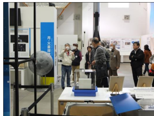
JAXA宇宙研究所の見学

次に向かったのは、山名会の趣とは少しズレるかも知れませんが、相模原のJAXA宇宙研