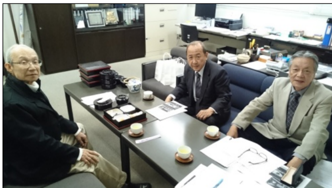
役員会をお借りしての京大経済短大長室を借りしての役員会。ゆったりとした学長室で相談も沢山出来ました。ご配慮に感謝申し上げます。

御案内開始当初は反応が少なく「50名集まるかどうか?」と、閑散とした会場風景となることを心配しておりましたが、役員各位の働きかけもあり、産経新聞・京都新聞でも行事