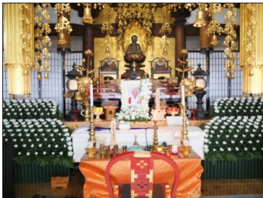
皆様からのご協力をいただき、見送る事が出来ました。