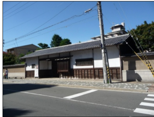
有栖館（旧有栖川宮邸）の門（右上）と大広間（左上）：講演会場の予定 平安女学院の明治館（右下）とエディカフェ内部（左下）：総会会場を予定。