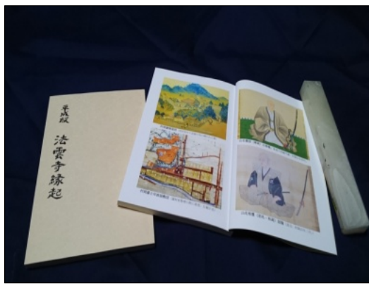
「物語山名氏八百年」と同様に読みやすい内容となっています。