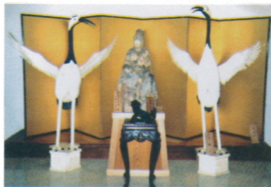
(1) 観音さまと比翼の鶴