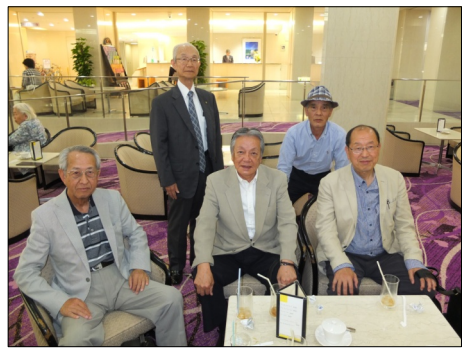
総会準備会 (6/10) にご出席戴いた都京のルビノ会場の懇親会。役員の方々の面々。

尚、西陣織会館の利用時間は午後5時までなので、行事後の懇親会などは別会場を手配せねばなりません。懇親会に付きましては、西陣織会館から700メートルほど離れたルビノ京都堀川で行う予定にしており、この会場にも足を伸ばして会場の確